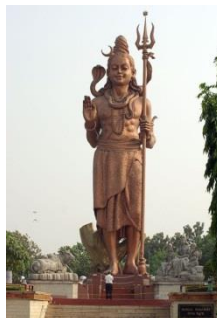
Den hinduiska guden Shiva med sin treudd, treshul