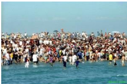
Sankta Sara bärs till vattnet i Frankrike Attribution Share Alike Some rights Av:Arjuna Filips (Eget arbete) Reserved, by Fiore S. Barbato